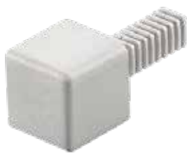
SJC - A